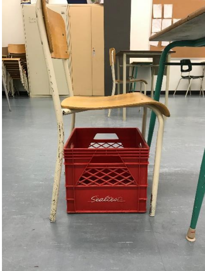
Caisse de lait